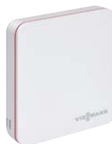
Termostat ViCare pro více komfortu a vyšší účinnost.