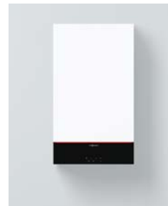
Vitodens 100-W (B1HF a B1KF).

Kotle Vitodens 100-W/111-W jsou přezkoušeny pro zemní i zkapalněný plyn a schváleny podle ČSN EN 15502. Odchylka jmenovitého tepelného výkonu u provozu se zkapalněným plynem viz projekční návod.