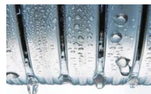
Tepelný výměník Inox-Radial.

Na nerezové výměníky tepla Inox-Radial v kondenzačních kotlích Vitodens do 150 kW garantujeme 10letou záruku.