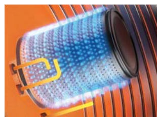
Účinný hořák MatriX-Plus.

Další technickou inovací firmy Viessmann je plně automatická regulace spalování Lambda Pro. Samočinně se přizpůsobuje všem druhům plynu a zajišťuje plynule čisté a účinné spalování.