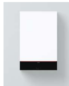
Vitodens 111-W (B1LF).