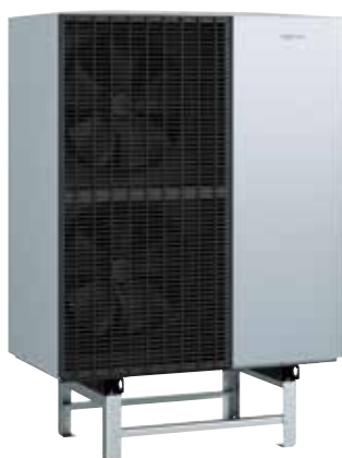
Venkovní jednotka Vitocal 151-A s podlahovou konzolí.