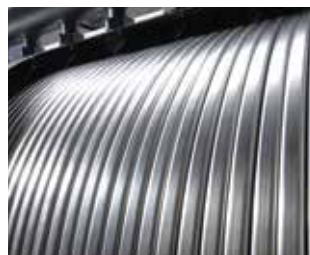
Inox-Radial – vysoce účinný patentovaný tepelný výměník.

Pro regulaci kaskády je k dispozici Vitotronic 300-K. Displej se srozumitelným textem s grafickou podporou poskytuje vysoký komfort obsluhy. Na přání lze Vitodens 200-W přes zařízení Vitogate 200 zapojit i do systémů automatizace budov.