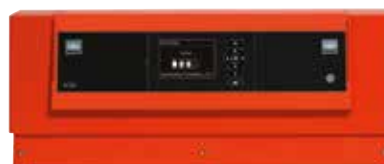
Kaskádová regulace Vitotronic 300-K.

S integrovanou regulací spalování Lambda Pro Control je Vitodens 200-W připraven na budoucnost. Tato regulace nastavuje kotel automaticky na různé druhy plynu. Kotel lze provozovat i s přimíchaným bioplynem nebo zkapalněným plynem. Při údržbě plynového kondenzačního kotle ušetříte mnoho času. Všechny díly jsou přístupné zepředu, není potřeba boční servisní odstup. Navíc si energetický systém vystačí jen s několika náhradními díly.