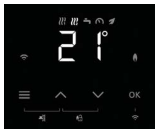
LED displej se 7segmentovým zobrazovačem a dotykovými tlačítky.