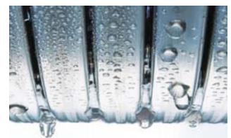
Výměník tepla Inox-Radial.

Na nerezové výměníky tepla Inox-Radial v kondenzačních kotlích Vitodens do 150 kW garantujeme 10letou záruku.