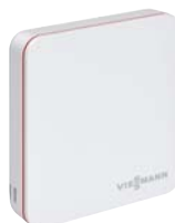
Termostat ViCare pro více komfortu a vyšší účinnost.